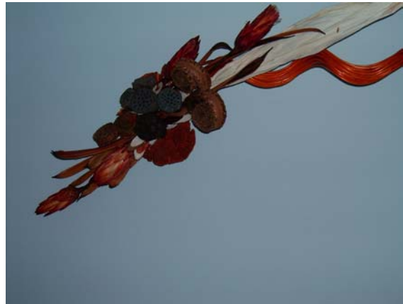
Részben saját termesztésű növényből készült termékek