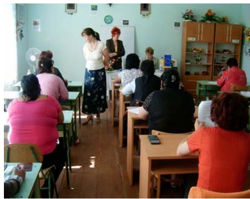
A vizsga képei